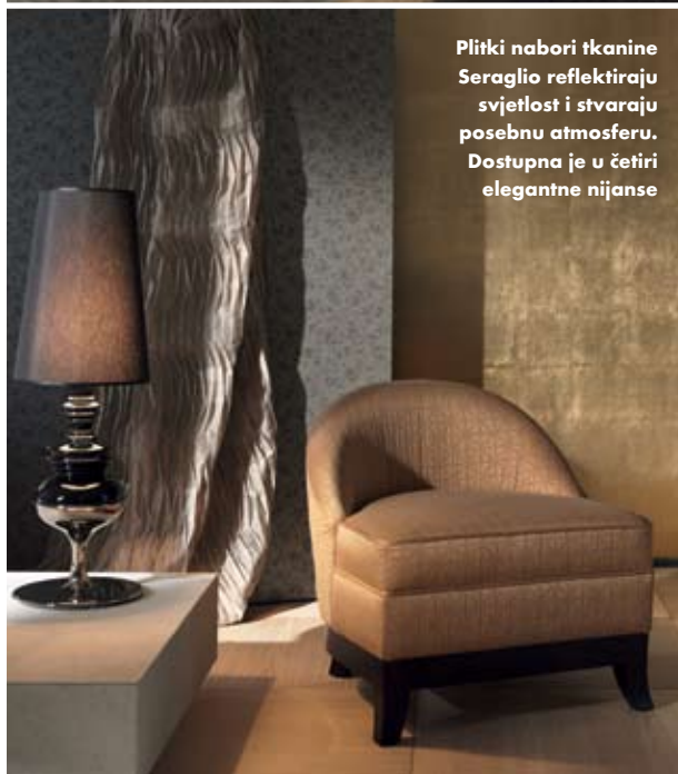
Plitki nabori tkanine Seraglio reflektiraju svjetlost i stvaraju posebnu atmosferu. Dostupna je u četiri elegantne nijanse