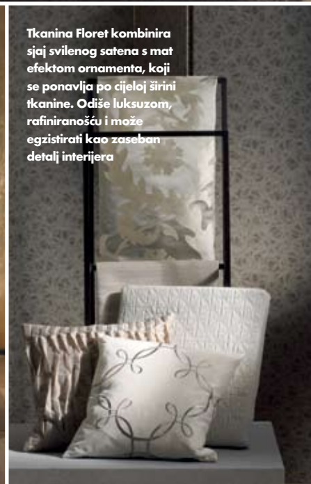
Tkanina Floret kombinira sjaj svilenog satena s mat efektom ornamenta, koji se ponavlja po cijeloj širini tkanine. Odiše luksuzom, rafiniranošću i može egzistirati kao zaseban detalj interijera