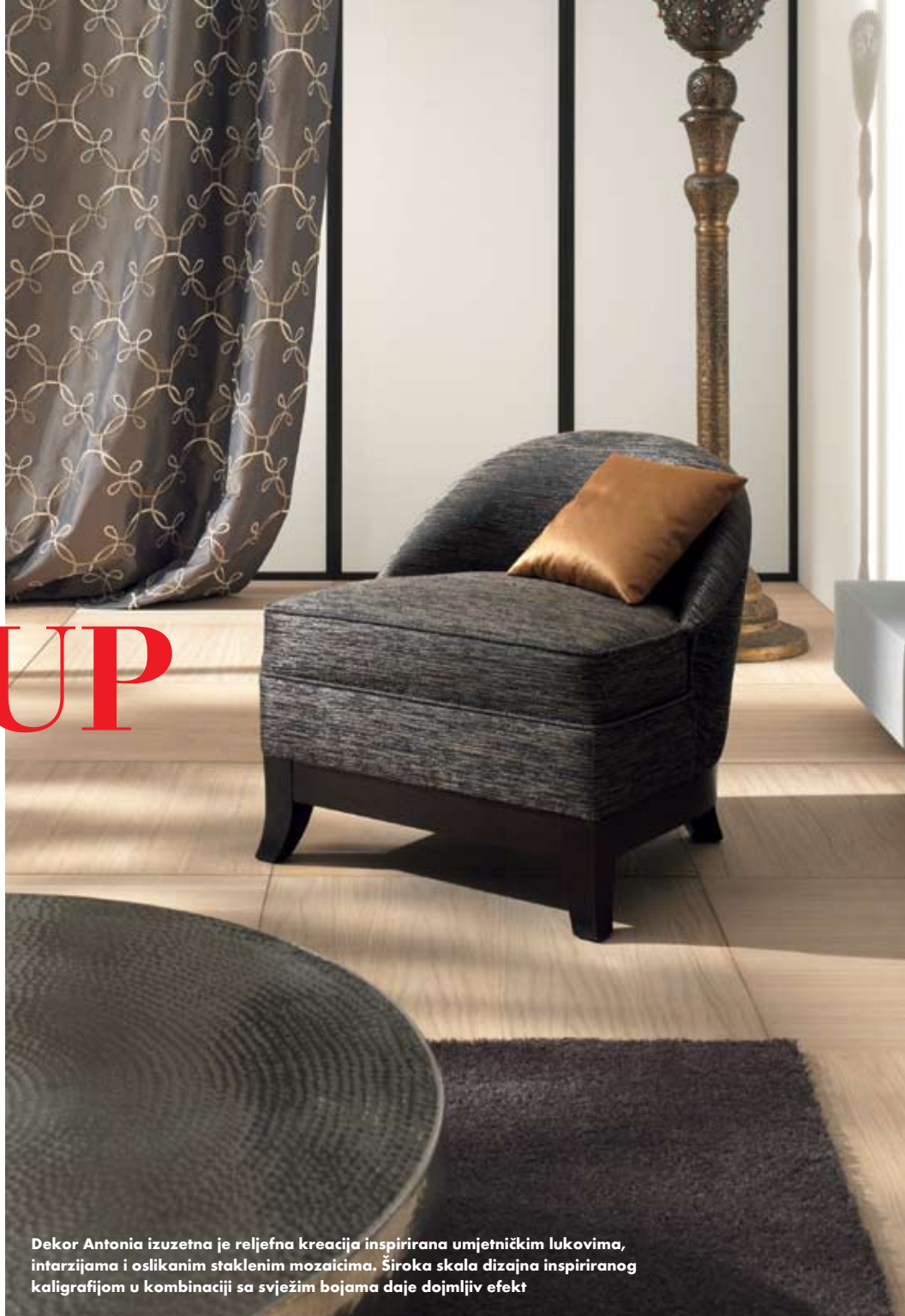
Dekor Antonia izuzetna je reljefna kreacija inspirirana umjetničkim lukovima, intarzijama i oslikanim staklenim mozaicima. Široka skala dizajna inspiriranog kaligrafijom u kombinaciji sa svježim bojama daje dojmliiv efekt